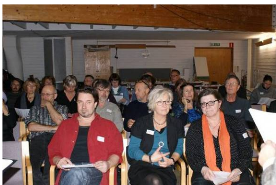
Intresserade deltagare på seminariet

Västarvet kommer att delta i en referensgrupp inom Landart och leder för att utveckla kulturarvets roll i projektet.