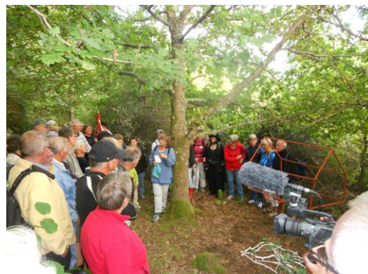
landartkonstverket huset diskuterades