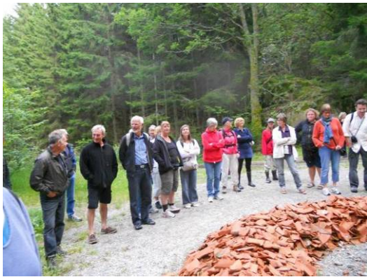
Ca 45 personer deltog i vandringen