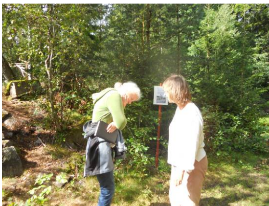
En trollslända beskådas