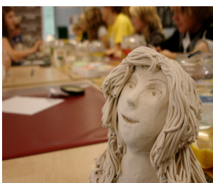
Ur serien identitet - vem är jag?